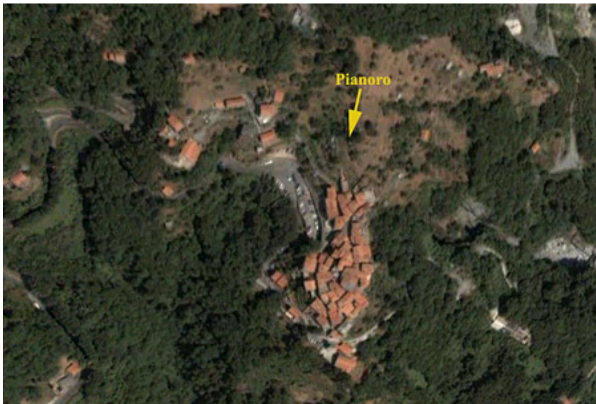
Pianoro sopra l'Osteria Poveruomo di Pruno