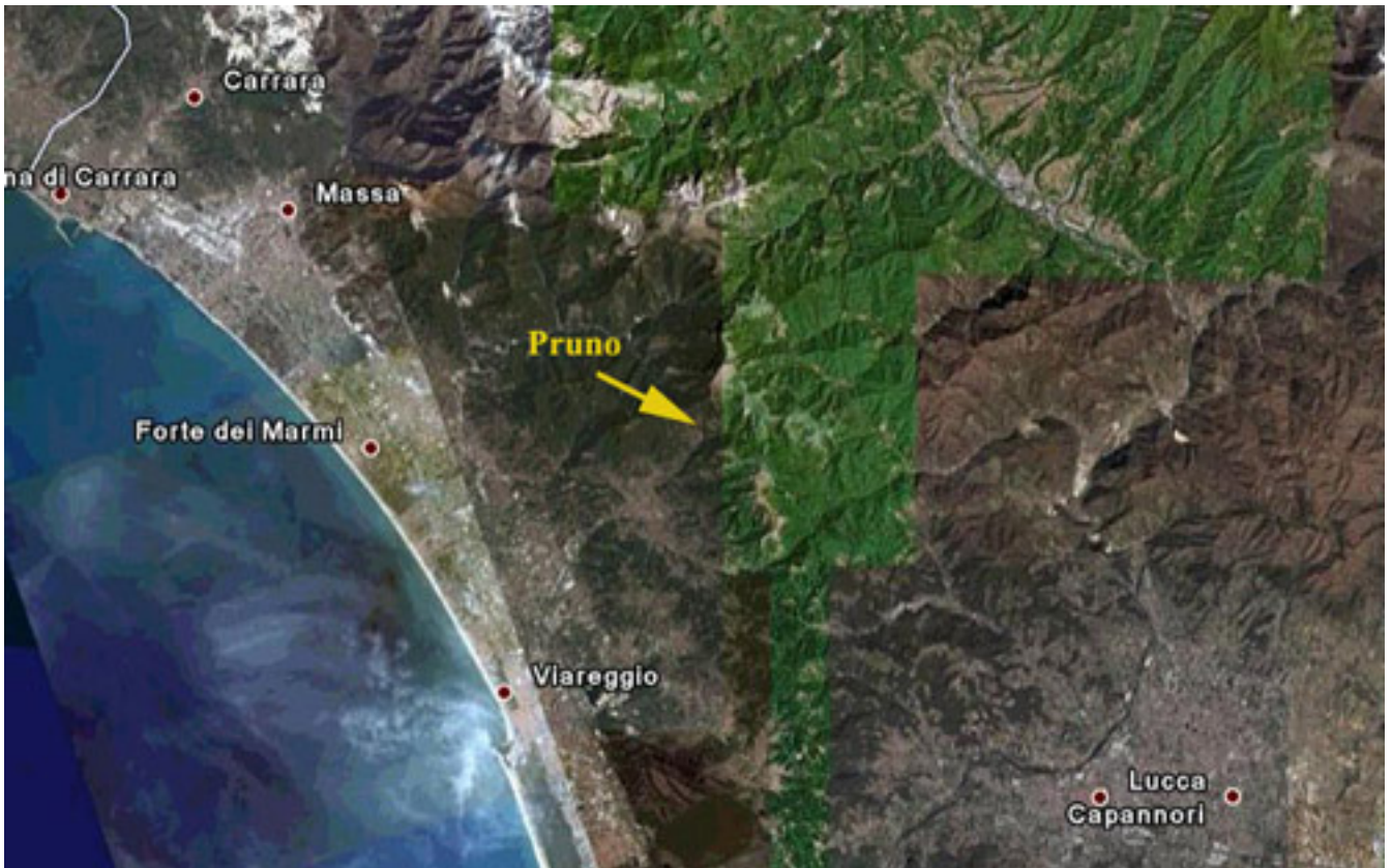
Posizione del paese di Pruno (Stazzema, Lucca)