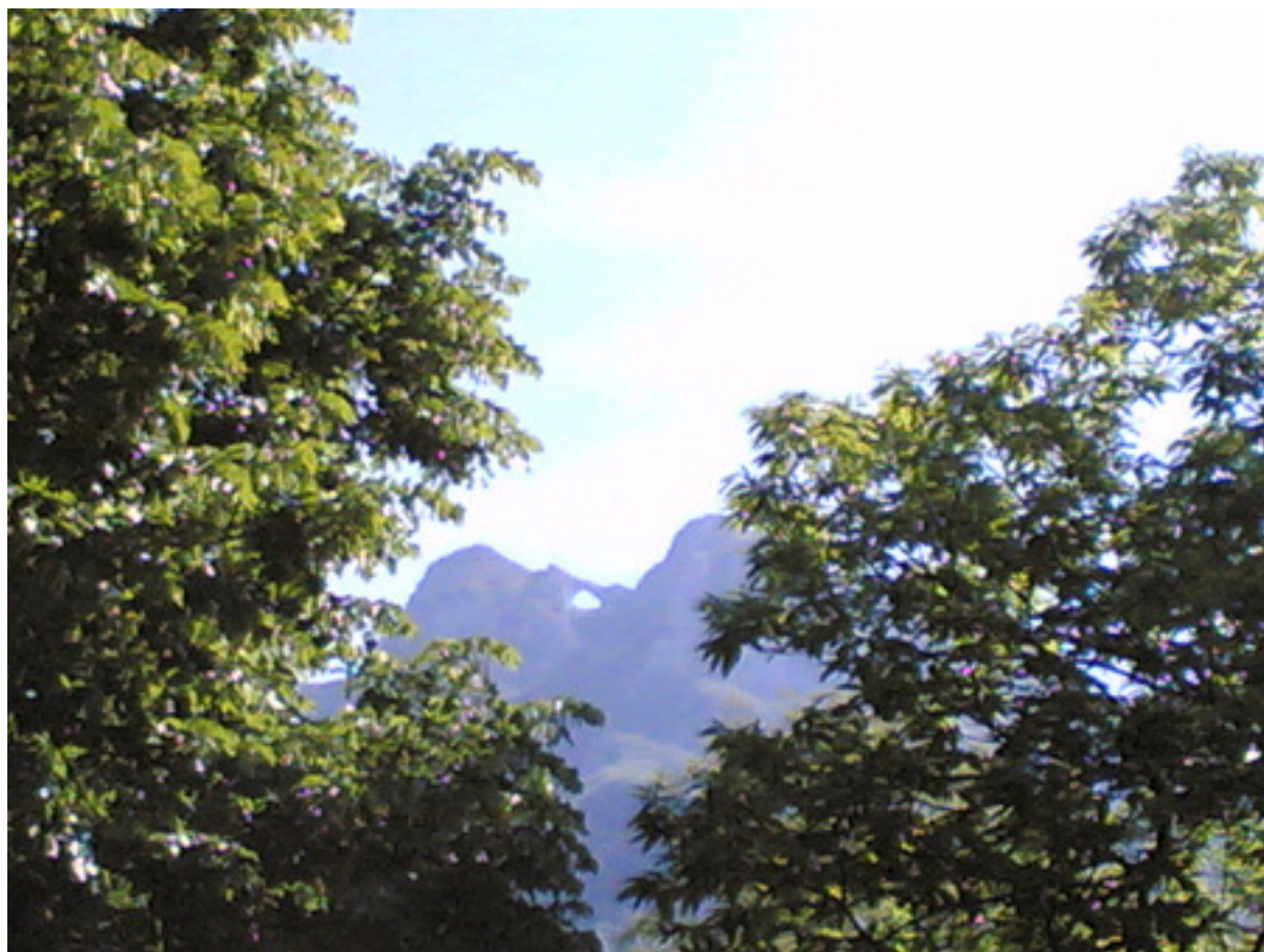
Monte Forato da Volegno