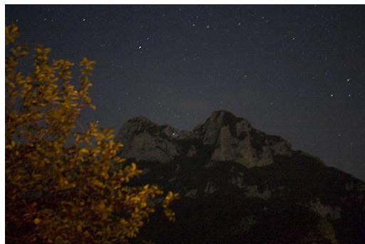
Passaggio della stella Iota Pegasi nel Forato (Magnitudine visuale: 3.77)