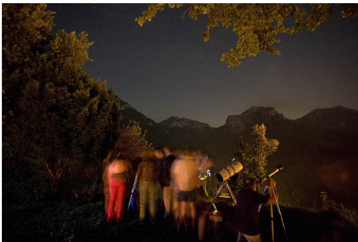
Astrofili durante lo Star party del 2007

Per approfondimenti rimando il lettore alla pubblicazione: “Le Apuane segrete” di Marco Lapi e Fiorenzo Ramacciotti edizioni “Il Labirinto”, che si può considerare una vera e propria “bibbia” non solo sul Forato ma sulle intere Apuane meridionali.