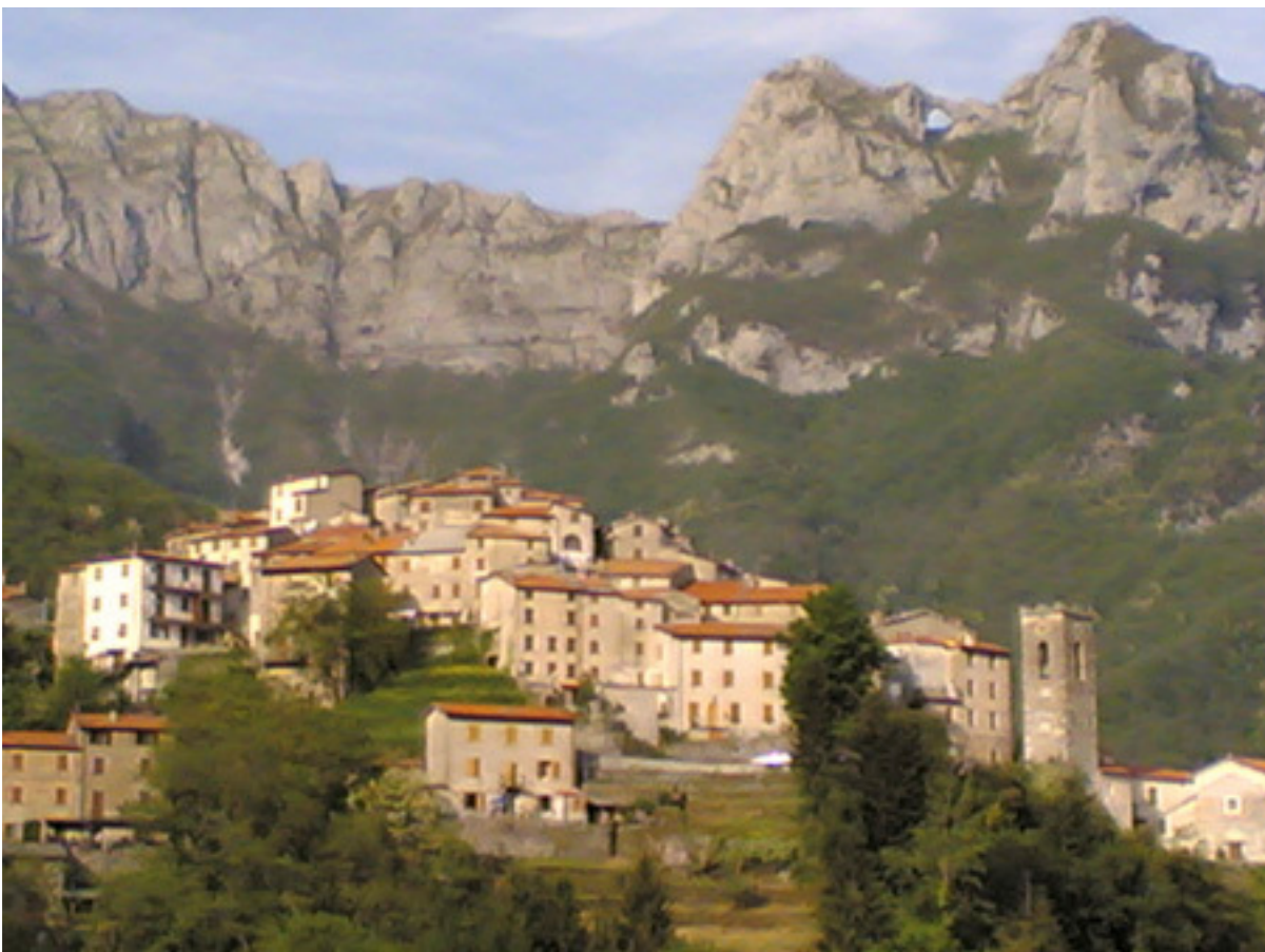
Il grazioso paese di Pruno con, alle spalle, il Monte Forato