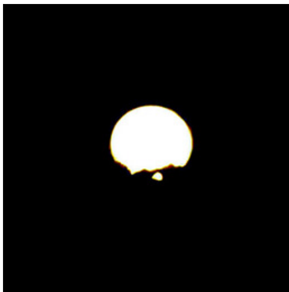
Dal Bagno Cinquale

BAGNO CINQUALE: IL 28 aprile e il 16 agosto; RISTORANTE MAX e BAGNO GALLIANO: il 27 aprile e il 17 agosto; BAGNI BERNA e L'APPRODO: il 26 aprile e il 18 agosto; BAGNO EDEN: il 25 aprile e il 19 agosto; BAGNI ALPEMARE e SPIAGGIA COMUNALE: il 24 aprile e il 20 agosto; BAGNI HENDERSON e GIRASOLE: il 23 aprile e il 21 agosto; BAGNI IVO e SPIAGGIA COMUNALE: il 22 aprile e il 22 agosto; BAGNO NEDY: il 21 aprile e il 23 agosto; BAGNI CHIRAMAIA e JUNGLA: il 17 aprile e il 27 agosto; BAGNI MONIA e SORRISO: il 16 aprile e il 28 agosto.